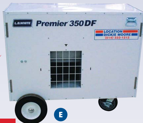
E Chauffeurette au gaz naturel / propane