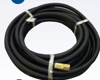
Conduit de ventilation