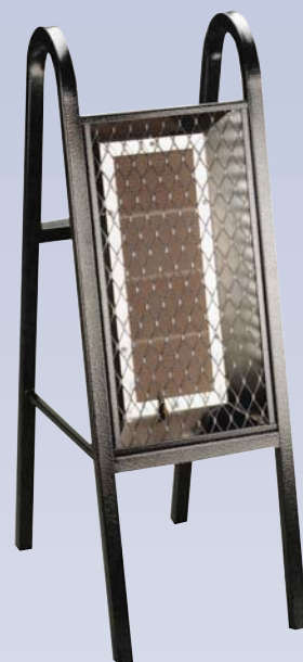
C Chauffeurette au propane Infra-rouge