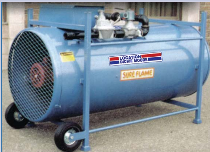
A Chauffeurette Propane/Gaz naturel