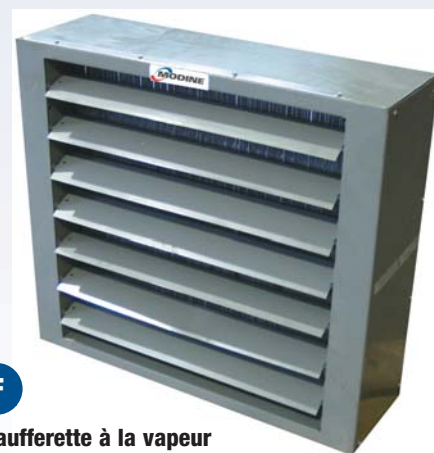
F Chauffeurette à la vapeur