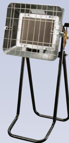
B Chauffeurette au propane Infra-rouge