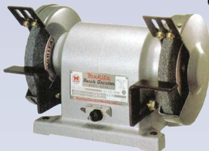
E Touret d'établi