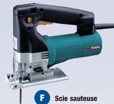
F Scie sauteuse