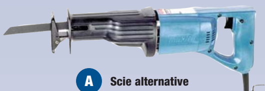
A Scie alternative