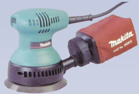
C Ponceuse omnidirectionnelle