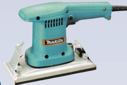
F Ponceuse de finition