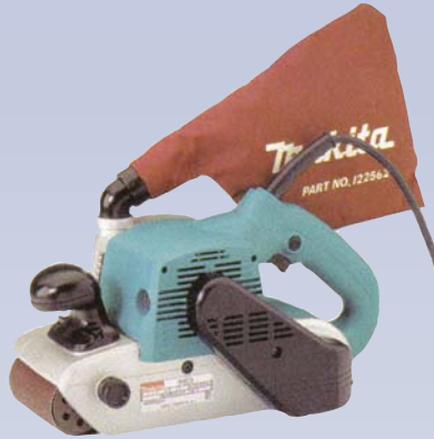
B Ponceuse à bande