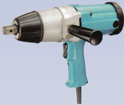
A Clef à chocs