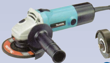
B Meuleuse électrique coudée