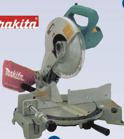
D Scie à onglets