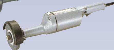
C Meuleuse électrique droite