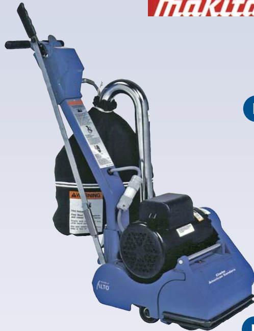
E Ensemble ponçage à plancher