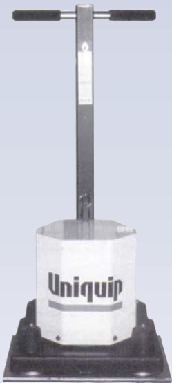
D Ponceuse à plancher omnidirectionnelle