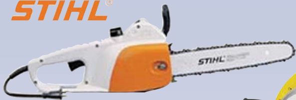
A Tronçonneuse électrique