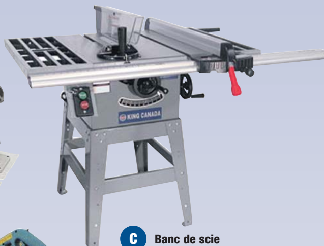
C Banc de scie