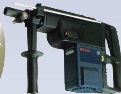
F Marteau rotatif électrique