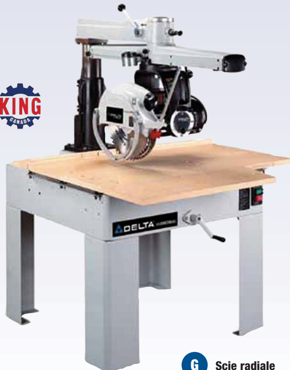
G Scie radiale