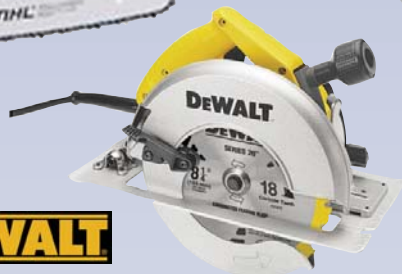
B Scie circulaire