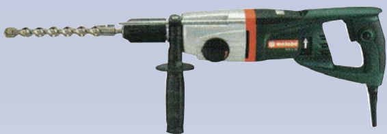
A Perceuse électrique à percussion