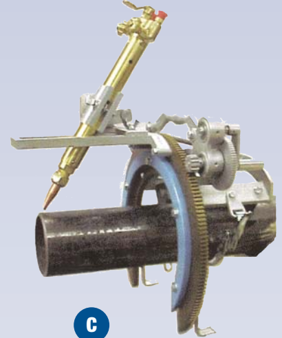
C Machine à chanfrainer