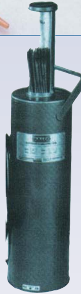
E Étuve à électrode - 10 lbs